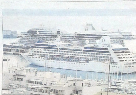
• R.D. Los cruceros de lujo 'Riviera' e 'Insignia', juntos en Palma el pasado viernes