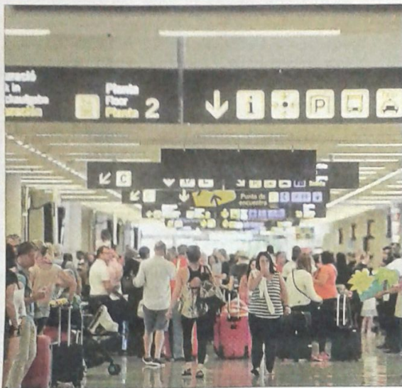
El tráfico de pasajeros en Son Sant Joan es muy intenso este fin de semana.

De otra parte, una avería en el sistema informático que gestiona